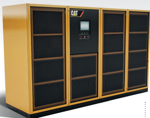
Cat ® UPS 750