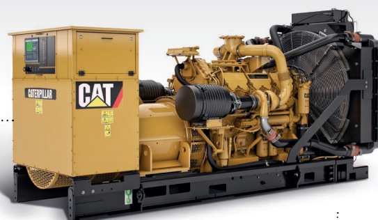
Motorgenerátor Cat ® C32